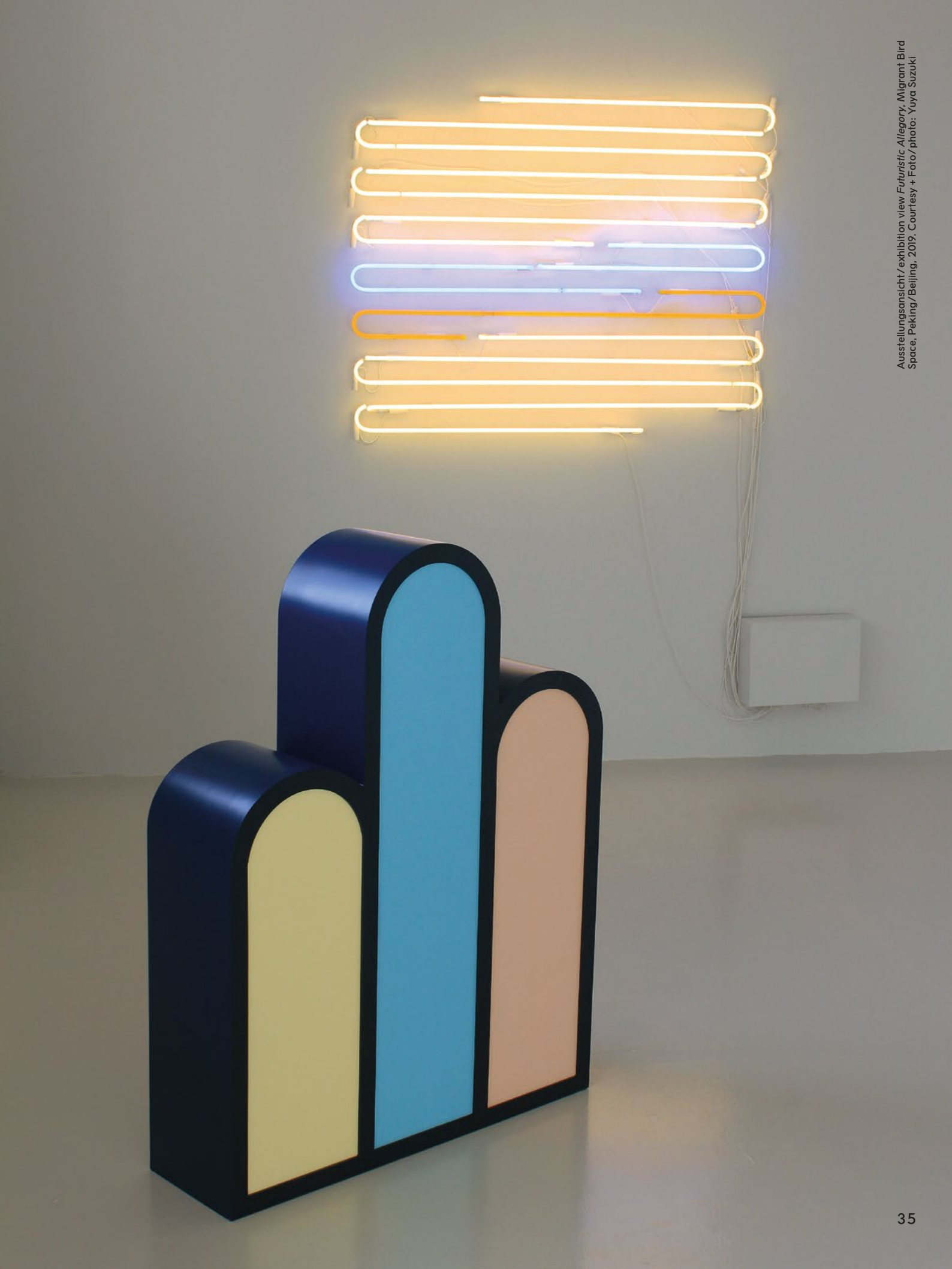
Ausstellungsansicht / exhibition view Futuristic Allegory, Migrant Bird Space, Peking/Beijing, 2019.