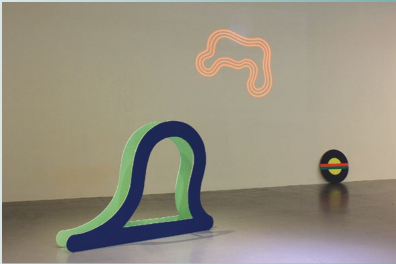
Ausstellungsansichten/exhibition views Remaking Ghosts, Siao-Long Cultural Park Gallery, Tainan, 2017.