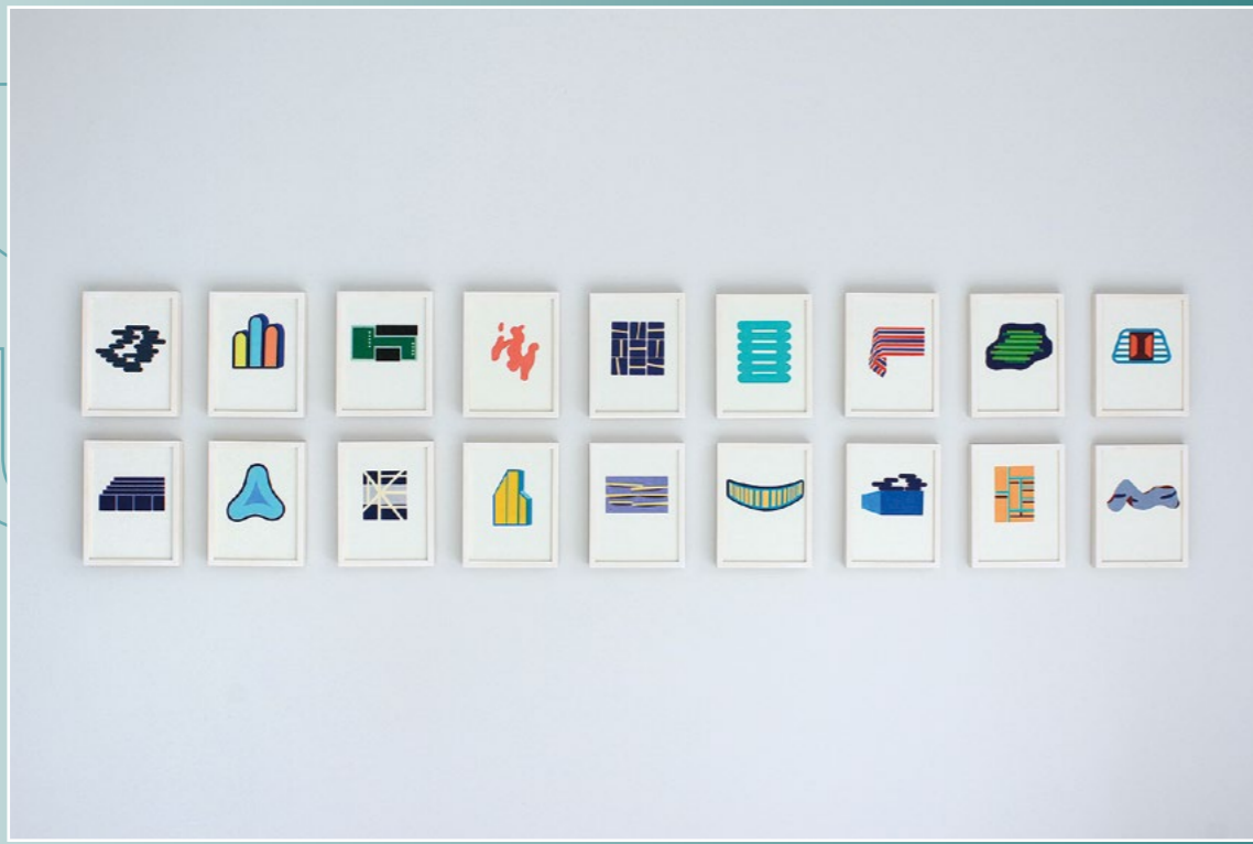
archegraph study_Beijing, 2019, Farbstift auf Papier / color pencil on paper, je / each 28 x 21 cm, Ausstellungsansicht / exhibition view Futuristic Allegory, Migrant Bird Space, Peking/Beijing, 2019.