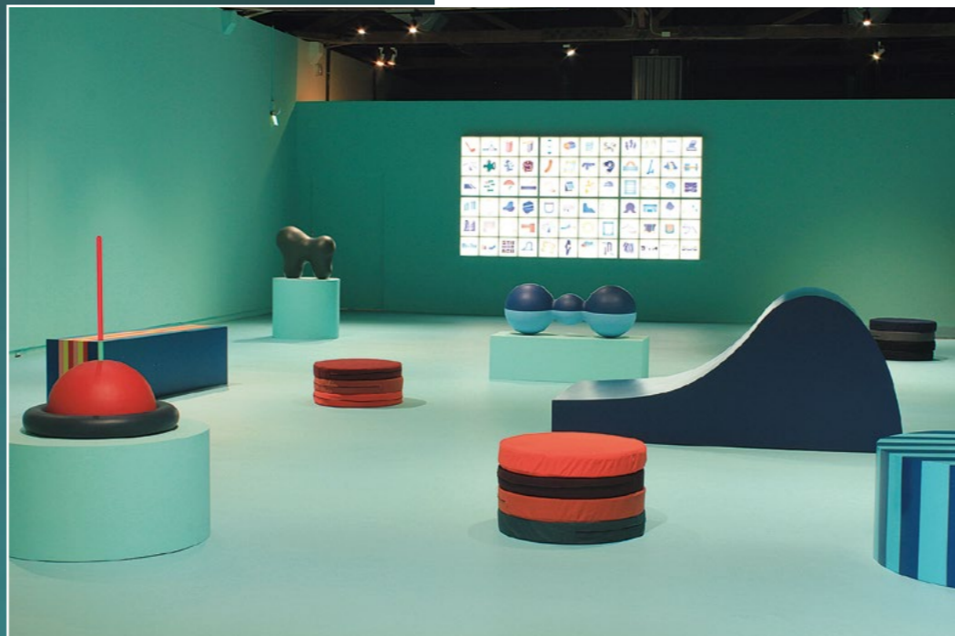
Ausstellungsansicht/exhibition view Phantoms Agora , Siao-Long Children's Museum of Art, Tainan, 2019.